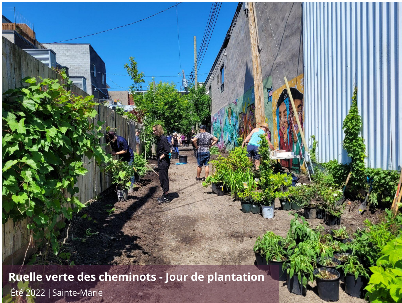
Ruelle verte des cheminots - Jour de plantation