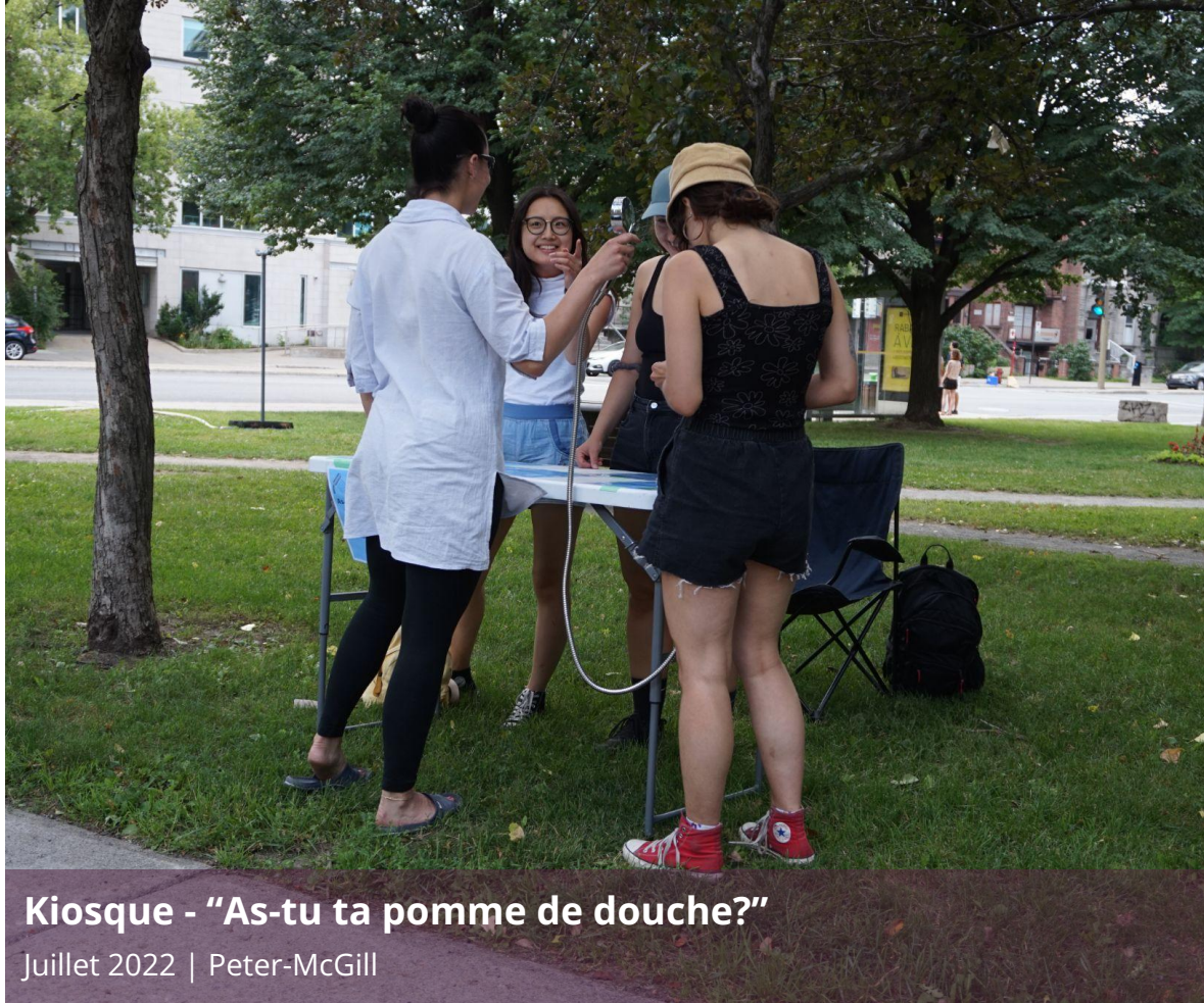
Kiosque - "As-tu ta pomme de douche?"