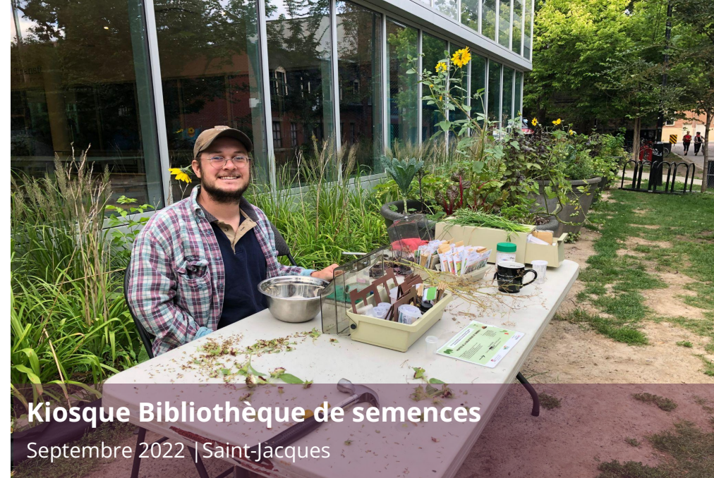
Kiosque Bibliothèque de semencés

Mai 2022 | Sainte-Marie | Distribution de fleurs, fines herbes, arbres.