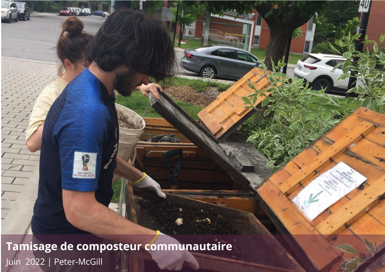
Tamisage de composteur communautaire